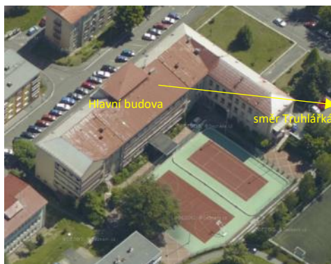
Základní škola Truhlářská - ul. Školní